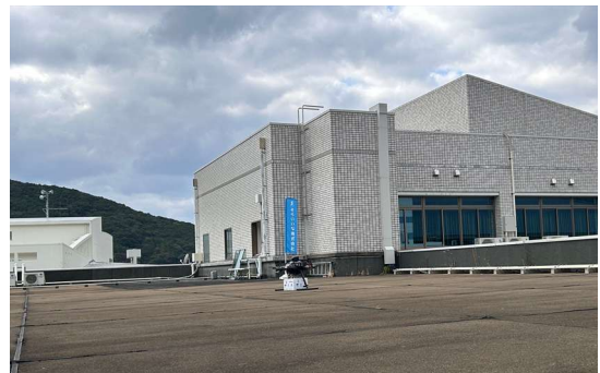
上五島病院の屋上に着陸するドローンの様子