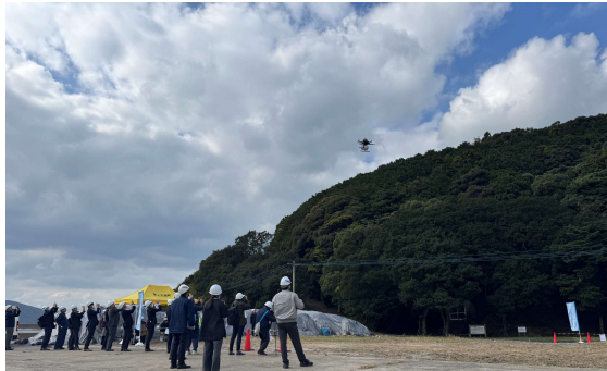
青方郷の中継地点から離陸するドローンの様子

そらいいなは、今後もドローン配送事業を通じた社会課題の解決を目指し、便利で持続可能なドローン配送サービスの実現に向けて取り組みを続けて参ります。