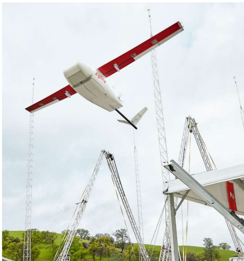
米国Zipline社製ドローンシステム